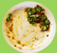
Restes de repas