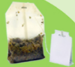
Sachets de thé