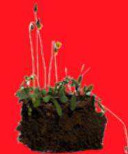
Mottes de terre