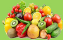
Fruits et légumes