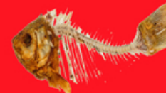
Arêtes de poisson